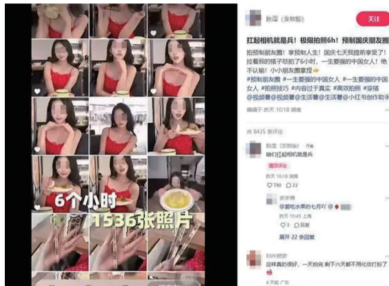
某博主的“预制朋友圈”式拍照得到了不少网友的赞赏

其实，“预制朋友圈”的说法是新瓶装旧酒，和过去提前保存在草稿箱、设置定时发送的做法异曲同工，它