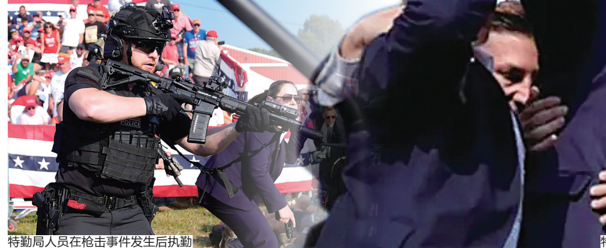
特勤局人员在枪击事件发生后执勤