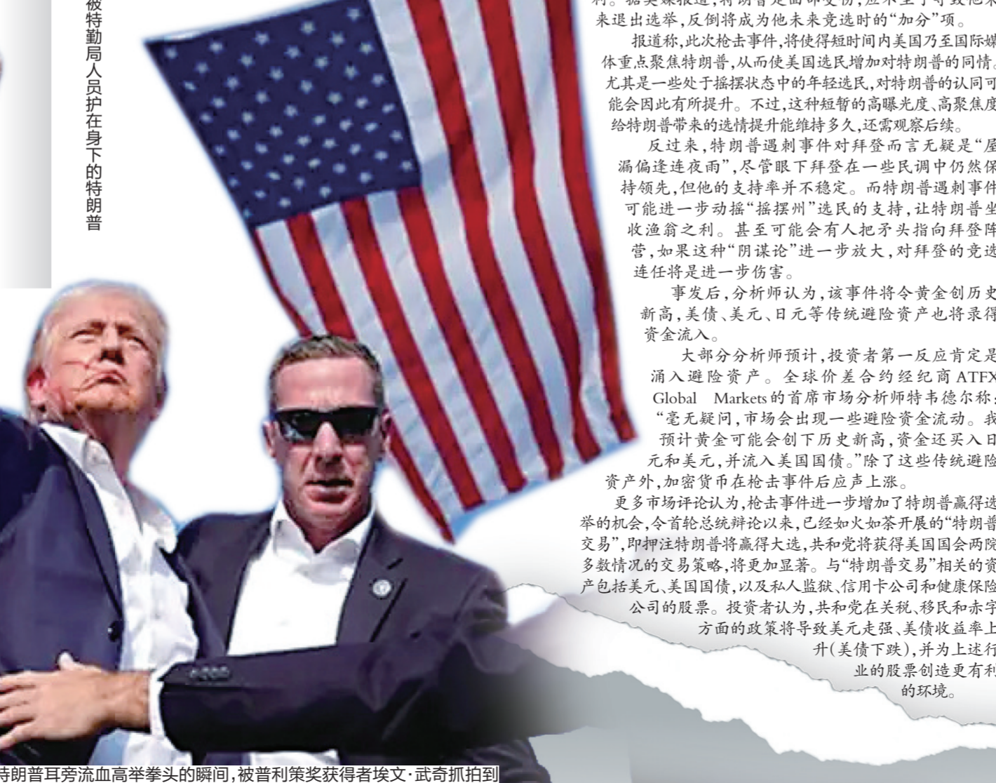
特朗普耳旁流血高举拳头的瞬间,被普利策奖获得者埃文·武奇抓拍到