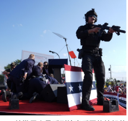
特勤局人员听到枪声后围住特朗普