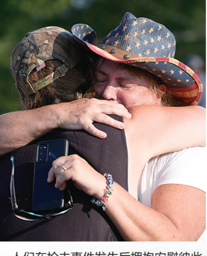
人们在枪击事件发生后拥抱安慰彼此