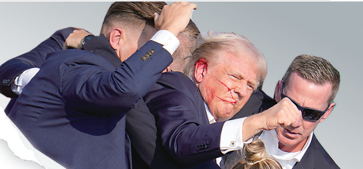
特朗普的右耳被击伤

更多市场评论认为,枪击事件进一步增加了特朗普赢得选举的机会,令首轮总统辩论以来,已经如火如荼开展的“特朗普交易”,即押注特朗普将赢得大选,共和党将获得美国国会两院多数情况的交易策略,将更加显著。与“特朗普交易”相关的资产包括美元、美国国债,以及私人监狱、信用卡公司和健康保险公司的股票。投资者认为,共和党在关税、移民和赤字方面的政策将导致美元走强、美债收益率上升(美债下跌),并为上述行业的股票创造更有利的环境。