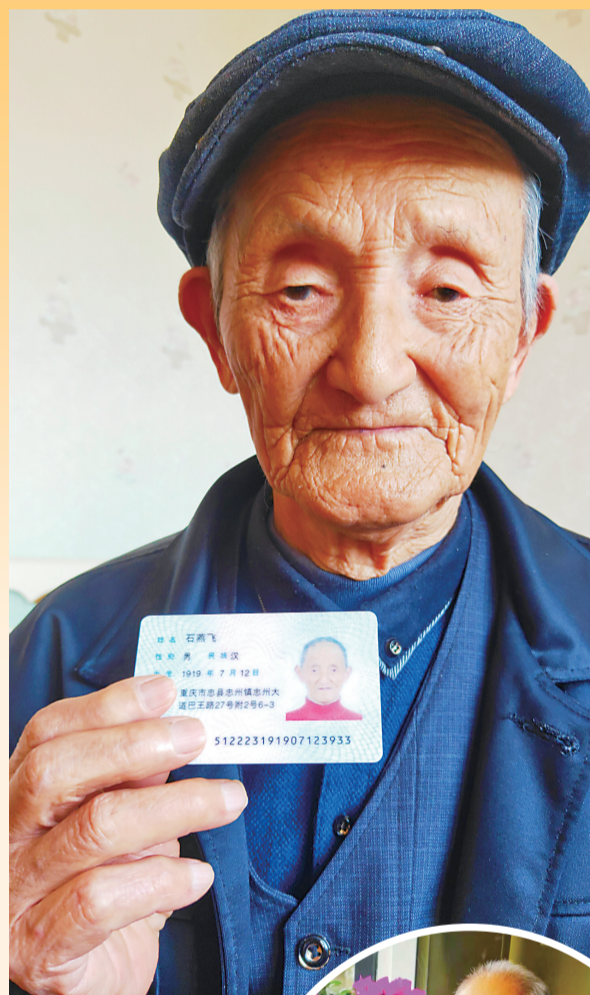
石燕飞老人的身份证显示他的年龄